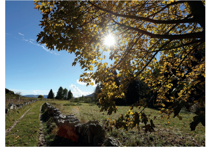
Herbestmånat / setémbre