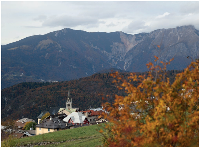
Bimmat / otóbre