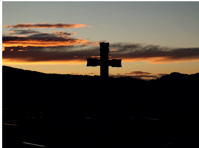
Bintmånat / novémber