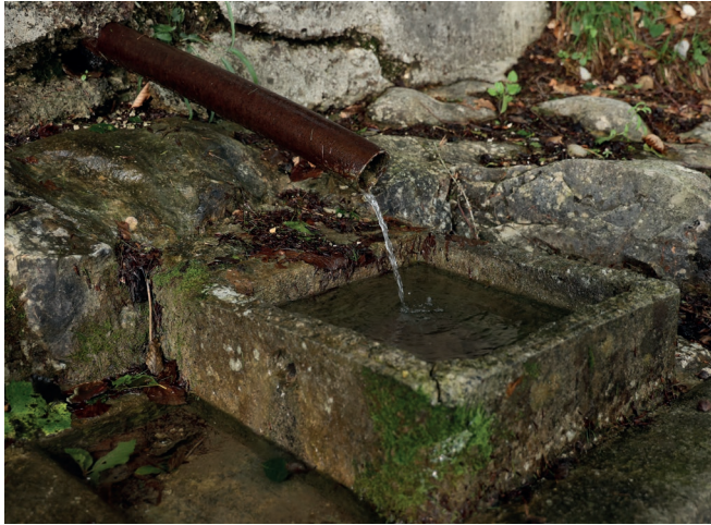
Höbiat / ludjo