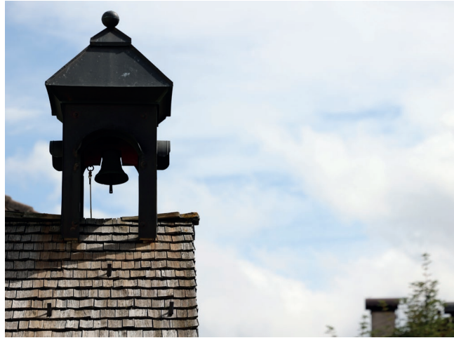
Snitt / agósto