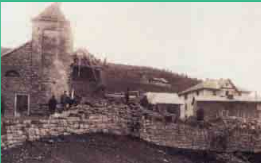
Foto von djardar von Earst Beltkriage: Eck (züntrest barntma no in kampanil in platz), di Khirch in Platz, dar Forte gesek von Gaso, un di kuppeln gespunk obar in Forte.

Fotografie storiche degli anni della Grande Guerra: Via Roma, la chiesa in piazza, il Forte Lusérn visto dalla Valmorta e cupole corazzate del Forte, divelte.