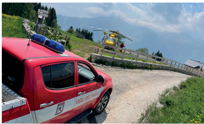
Una bella novità da parte dei Vigili del Fuoco di Luserna: 5 nuovi candidati hanno superato le prove ed inizieranno presto il corso per entrare a fare parte del Corpo!

Dar sèll von pompiarn iz a feròin vo volontàrdje, boda iz gest khent augelekk von Österrach no vor in earst Bèltkriage un gesichart habar