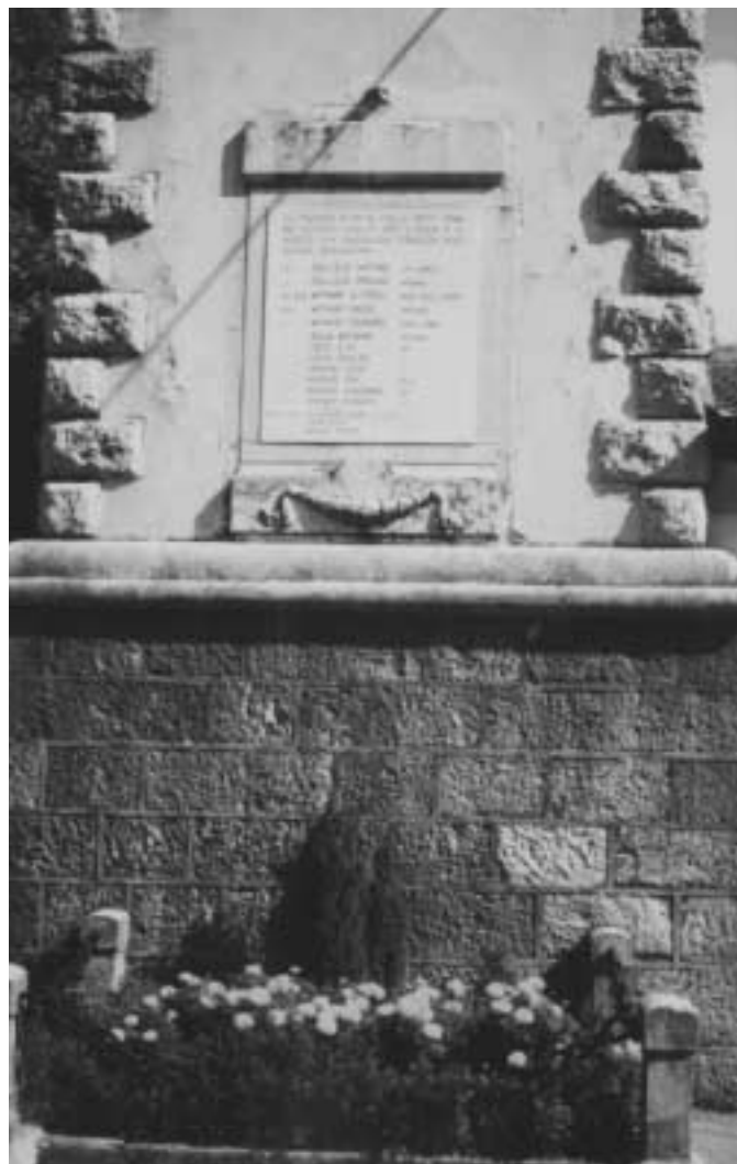
Monumento a Ponte Posta in Valdastico

Bisogna quindi, scendere giù, giù, lungo il torrente che ora scorre quasi in linea retta, come se fosse diventato un fiume importante. Da qui, se alzi lo sguardo, puoi ammirare le pareti verticali del-