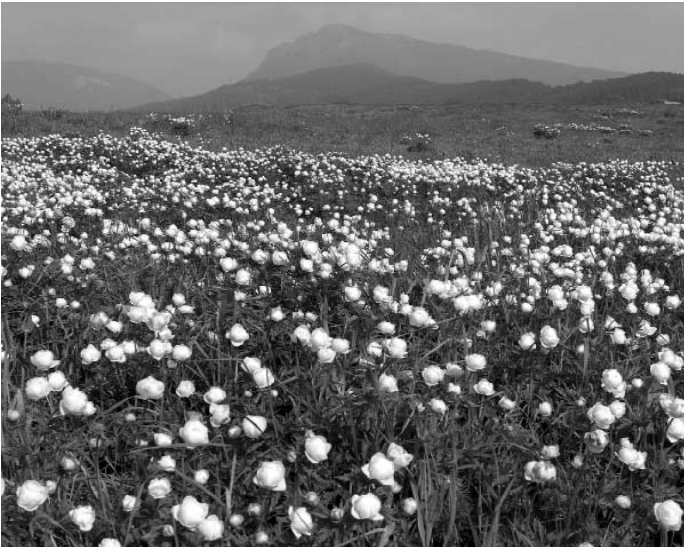
Distesa di ranuncoli e Pizzo di Levico in lontananza

An lestn, (albar un sbâm), hãmssa khöt: asta di laiüt gedenkhan bas dar en hat getânt Gott dar Hear, ben sa hãmnen vort getragt an öpfl, bas mai magatnsen in- paitn disa botta.