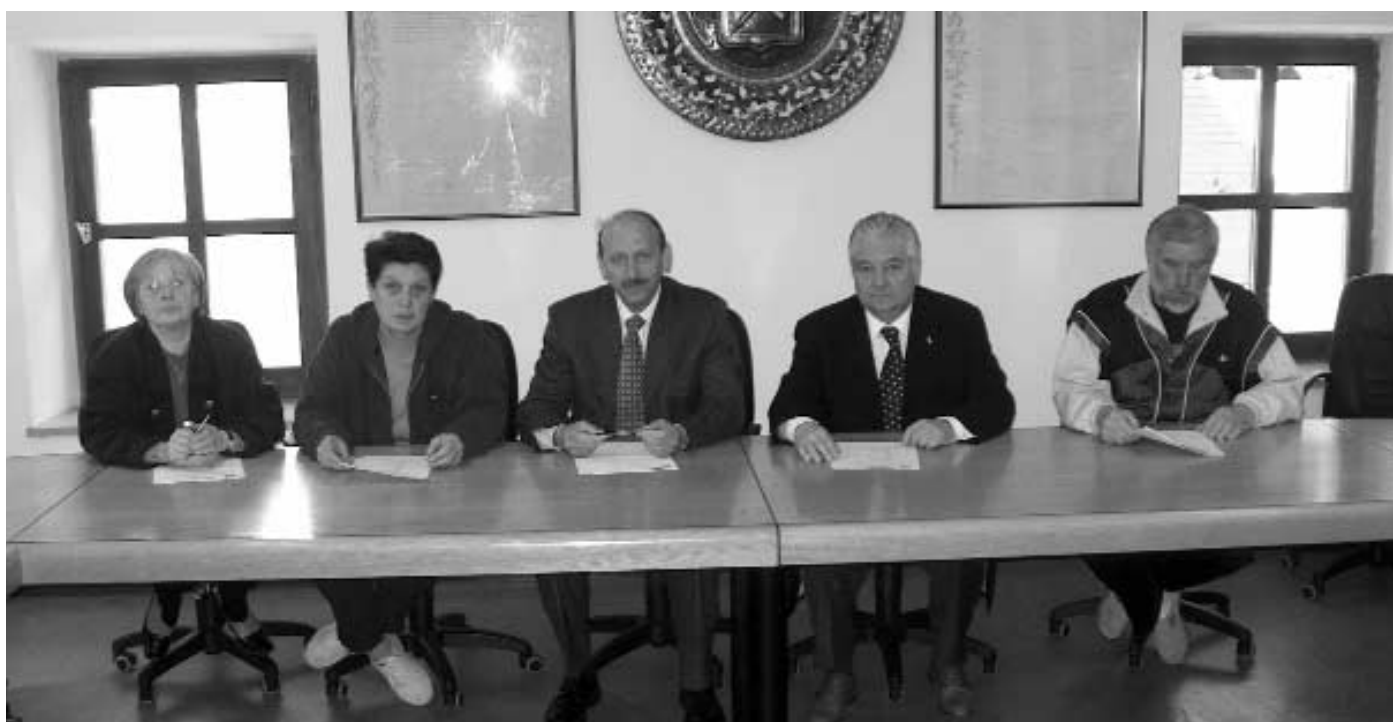
La nuova Giunta comunale