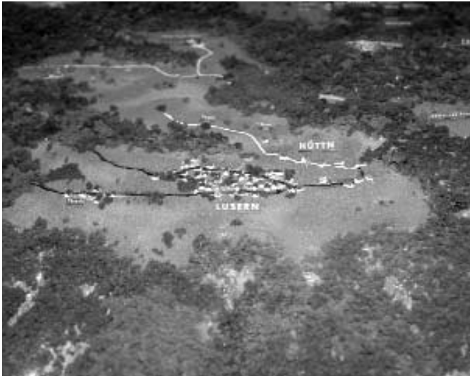
Plastico Altopiano di Luserna

«Luserna...conta 126 case e che ha, in base all'ultimo censimento (1900), 915 abitanti con diritto di residenza, tra cui 14 italiani. Il censimento ufficiale indica come popolazione presente 754 tedeschi e 14 italiani. All'entrata vi è la chiesa. Da qui parte una stradina con pavimentazione grezza in direzione nord, fiancheggiata da case su entrambi i lati. Questa parte del villaggio viene chiamata "Ek" ed i suoi abitanti "di ekar". Un'altra stradina fianchiata il lato lungo della chiesa verso est, ma gira a sudest subito dietro la chiesa. Anch'essa è pavimentata grossolanamente, con case rade al suo inizio; ma ben presto le case diventano più fitte e formano, oltre alla via principale, varie viuzze laterali. La piazza, da dove queste si diramano, si chiama s pil e l'estremità della via principale a sudest dar plez».