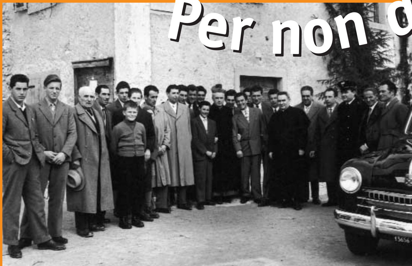
Visita del vescovo - anno 1955