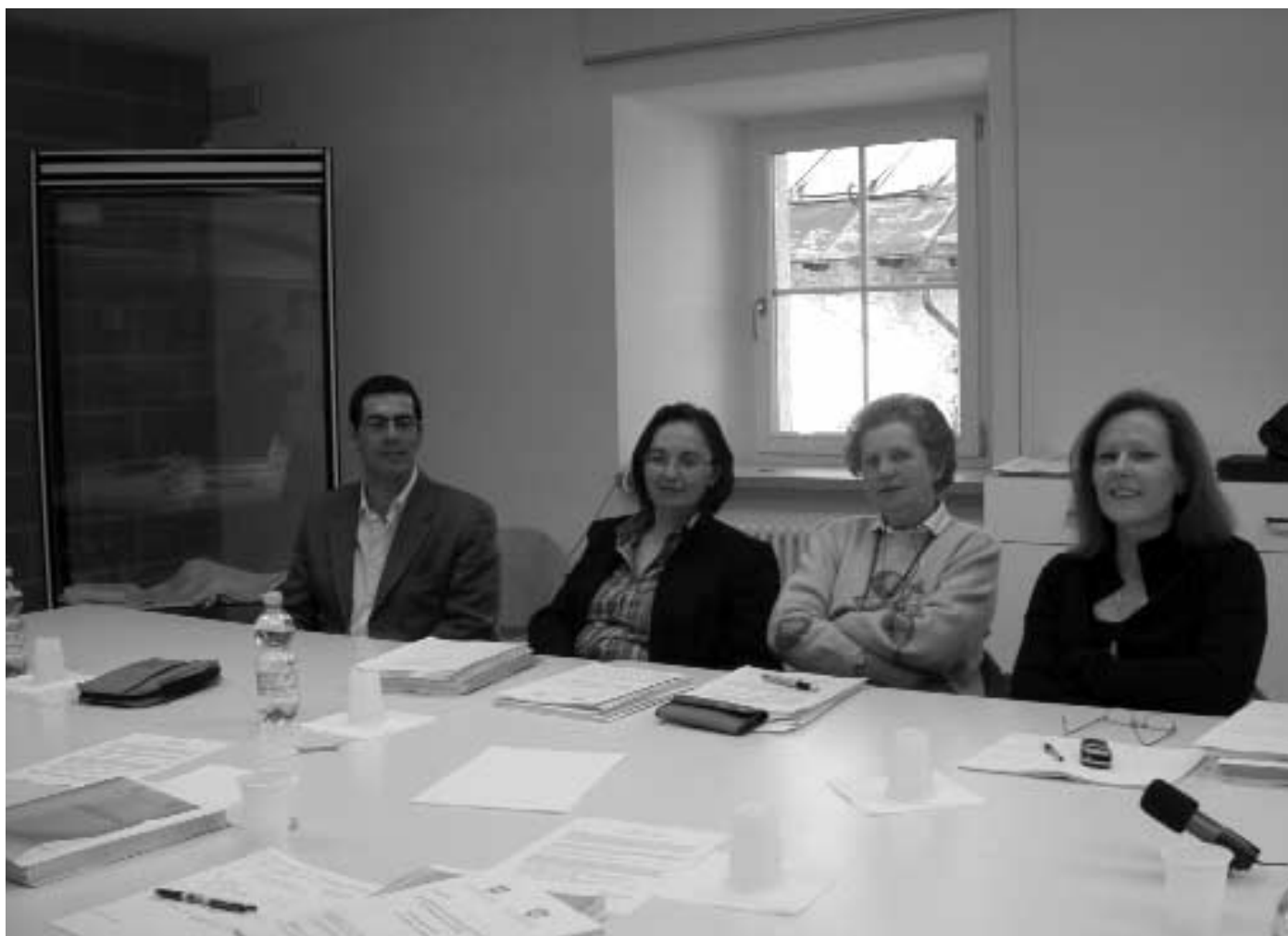
Comitato scientifico - Kulturinstitut