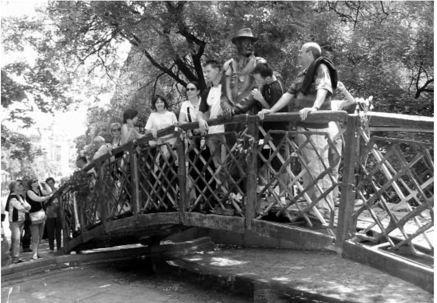
Gruppo di Luserni a Budapest

confini e spero che un giorno si possa andare dal Mediterraneo al Baltico nello stesso modo.