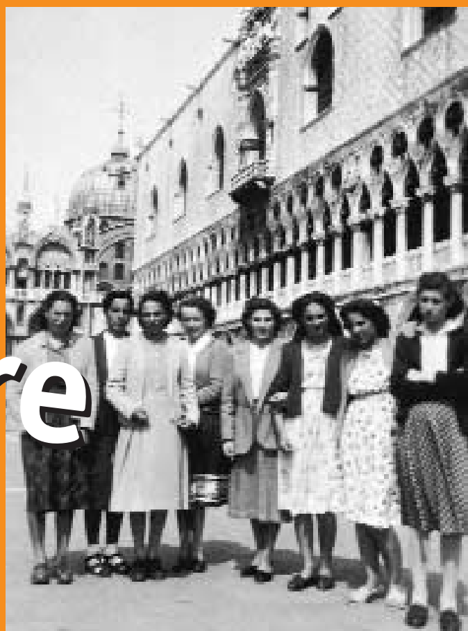
Ai piedi del Palazzo Ducale - anno 1952