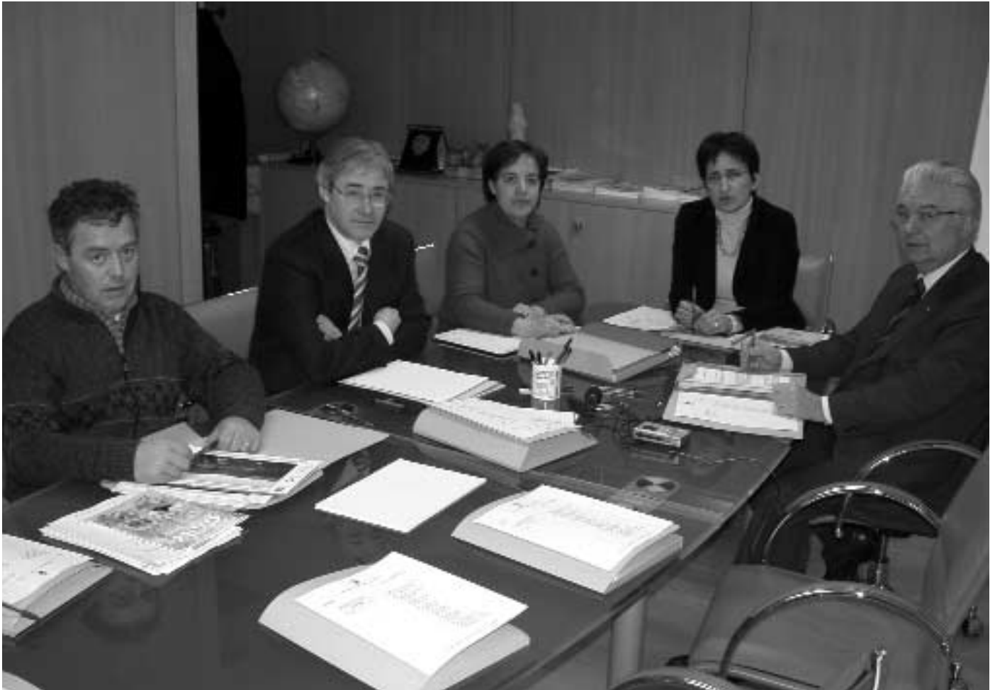
Consiglio di Amministrazione Kulturinstitut

sistenza e la continuità linguistica e culturale della nostra comunità.