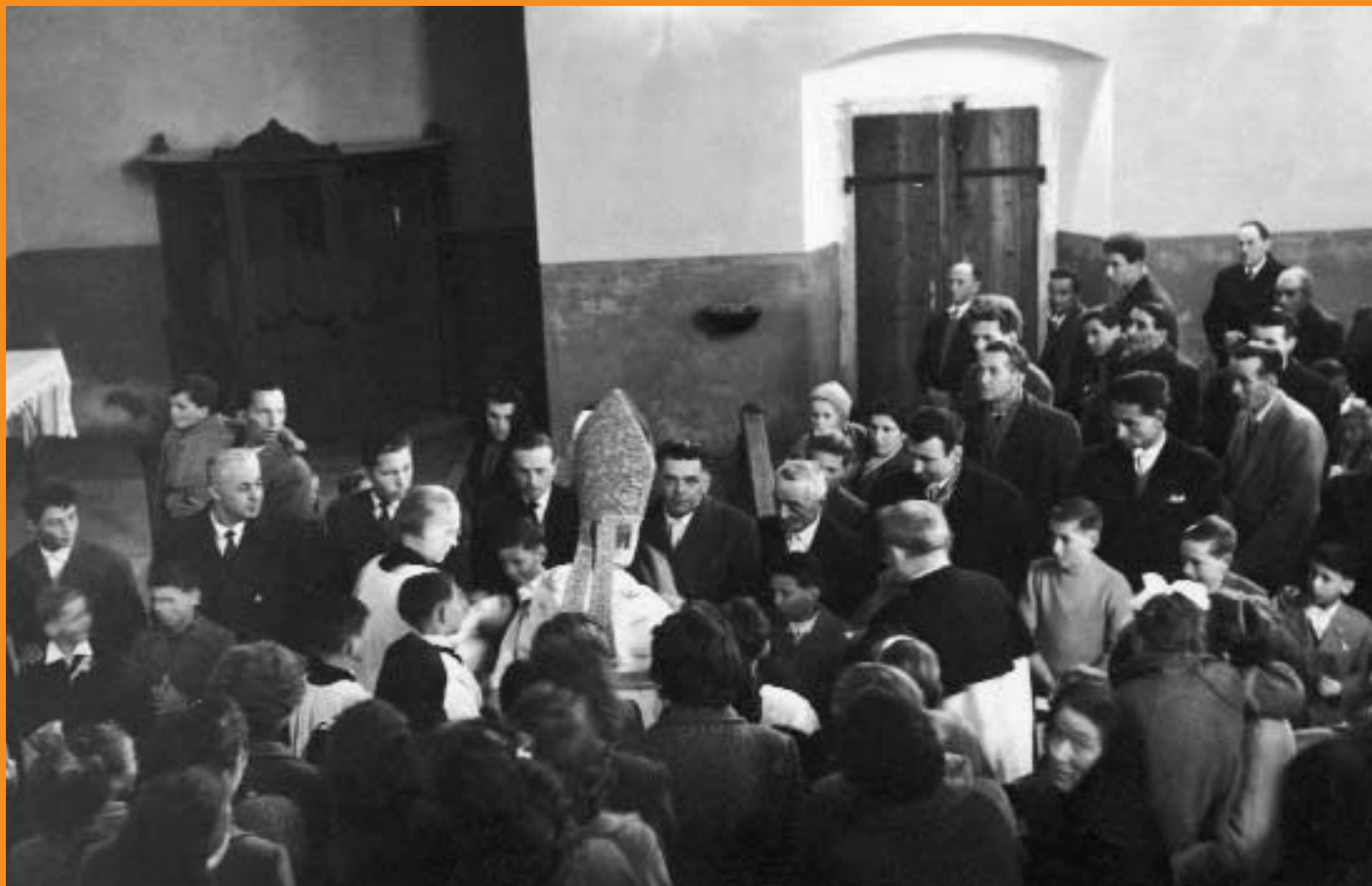
Visita del vescovo - anno 1955