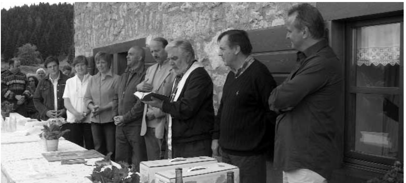
Inaugurazione Rifugio Alpino Malga Campo

Für Lusern handelt es sich um einen weiteren Schritt vorwärts auf dem Weg der wirtschaftlichen und touristischen Entwicklung: Im Jahr 2001 wurde der Gasthof LUSERNARHOF eröffnet, 1994 der AGRITURBETRIEB GALENO, einige Jahre zuvor das Restaurant MONTANA und die PIZZERIA DA MARIO, die zu den traditionellen Restaurants ROSSI, FERDI und RIVETTA hinzukamen. Acht Restaurants, davon drei mit Hotelbetrieb, in einer Ortschaft von 300 Einwohnern ist nicht wenig: Wenn sie sich behaupten konnten, so zeigt dies, dass die Gäste zufrieden sind und wiederkehren! Kulturelle Unterstützung bieten dabei das Doku-