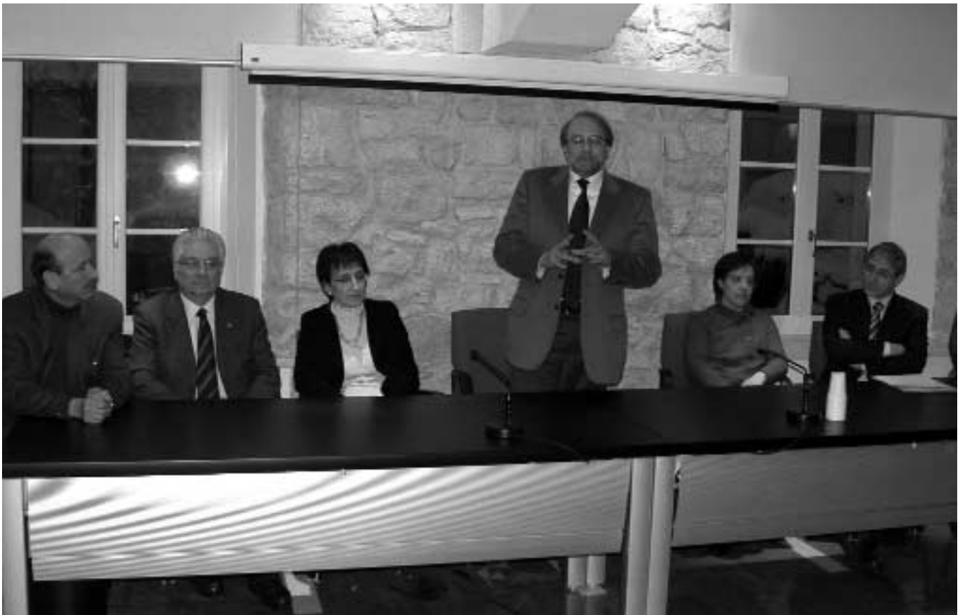
Insediamento Consiglio di Amministrazione Kulturinstitut - Lusern

Am 21. Februar 2005 fand im Beisein des Landeshauptmanns Lorenzo Dellai die Einsetzung des Verwaltungsrates statt, wobei sich das neu gegründete