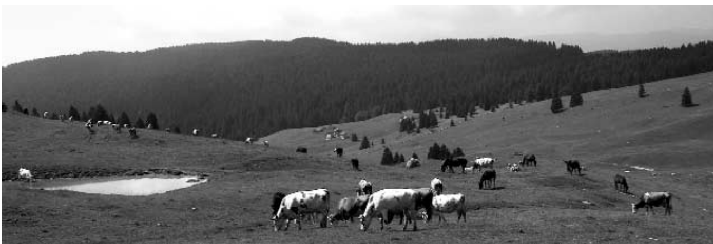
Vista dall'Obar Bisele

Vielleicht wären noch andere Personen zu nennen, derer wir gedenken sollten, doch haben wir keine Benachrichtigung erhalten. Wir ersuchen demnach um Angabe der Todesfälle, die die Familien der Luserner betroffen haben. Danke.