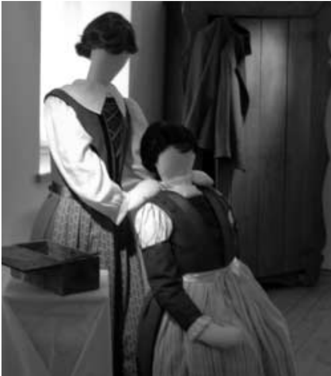
Abiti di Luserna

«Devono zappare per smuovere il terreno, dato che l'aratro non può essere impiegato per mancanza di bestie da tiro e spesso anche per la posizione del campicello. Dalla fine di maggio fino a metà giugno occorre mettere le patate e da quel momento i campi richiedono lavoro per tutta l'estate. Inoltre vanno coltivati i prati. In penen (come un piccolo cestone da carro) il letame viene portato sui campi; le lusernesi lo fanno posando la pen su una spalla e tenendola con la mano. Solo la mietitura non viene eseguita dalle donne, che allo scopo prendono braccianti, per lo più dalla vicina Italia. Le donne e ragazze portano a casa il fieno in grandi teli (lailachar). Si misura le dimensioni di un prato in base al numero dei fardelli di fieno: un tot di lailachar hÿbe. Per aumentare la scorta di fieno per l'inverno, le lusernesi tagliano nelle laitn spesso nei punti difficilmente accessibili erba e la seccano».