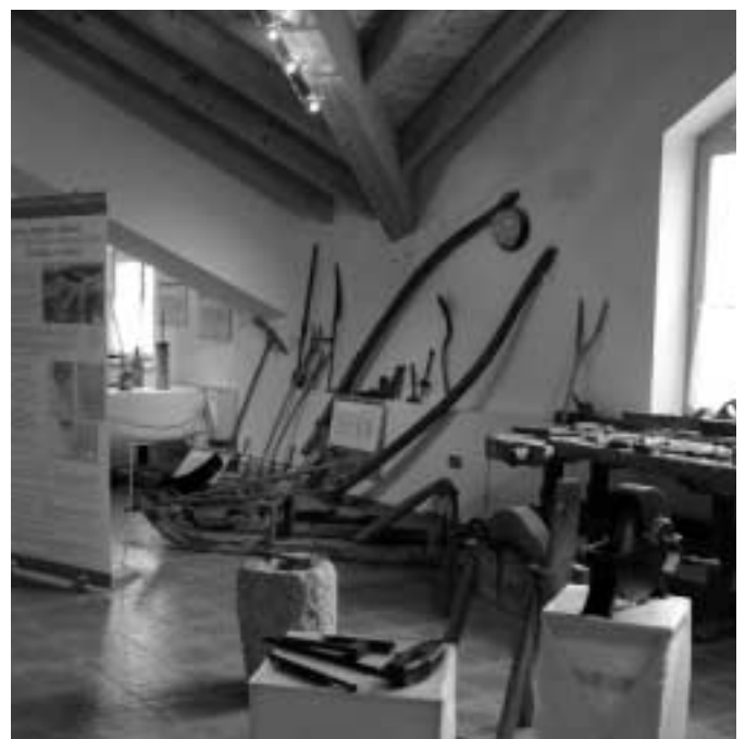
Esposizione attrezzi di lavoro

Außerdem können Sie uns auf der Internetseite www.lusern.it besuchen, die derzeit aktualisiert wird, oder unter der Telefonnummer 0464 -789638 bzw. der E-Mail-Adresse luserna@tin.it erreichen.