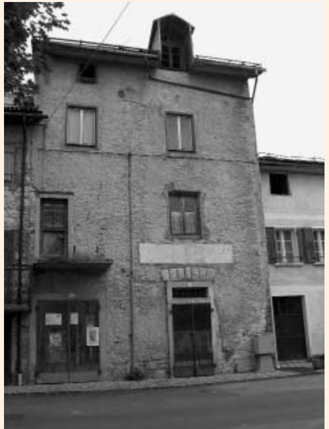
La casa Pedrazza futura pinacoteca