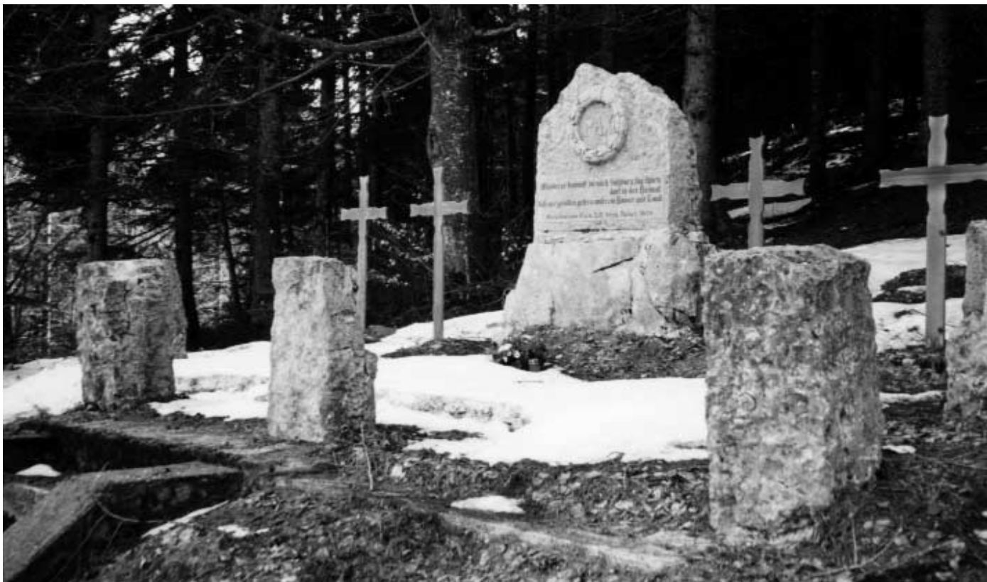
Monumento del 59° Reggimento Rainer sui Fiorentini

L'uomo prosegue il racconto e conclude andandosene: «A quelli dell'altra sponda la cosa non è andata giù... l'hanno considerata una offesa ai caduti!»