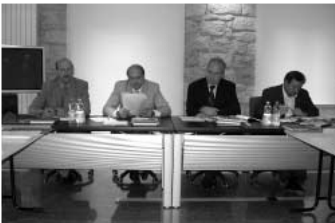
7ª Conferenza minoranze linguistiche

nun um einen Kindergarten oder eine Volksschule handelt, entspricht in keiner Weise den Erfordernissen der betroffenen Minderheit und würde die Abkehr von einer mehrjährigen Politik zum Schutz unserer Sprachminderheiten bedeuten, vor allem jener, die am meisten vom Schwinden bedroht sind. Ich glaube nicht, dass in einer Gegebenheit wie jener von Lusern rein mengenmäßige Kriterien gelten können, wenn doch die Schule zu den wertvollsten Reserven der zimbrischen Gemeinschaft von Lusern gehört“.