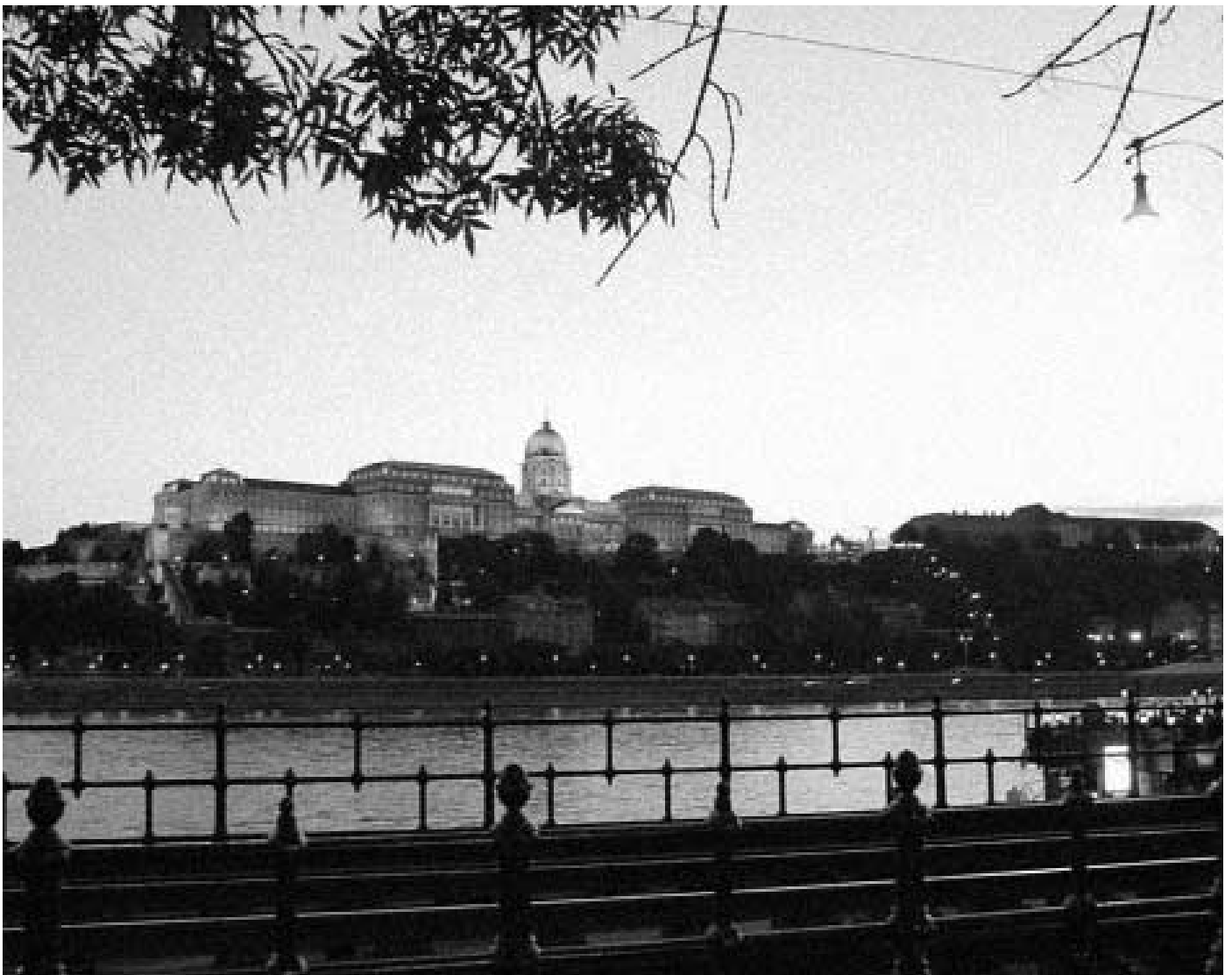
Il castello di Budapest

Bar soin-as gevuntet alle gerecht un khön an vorgels got aln in laüt boda soin khent pit üs!