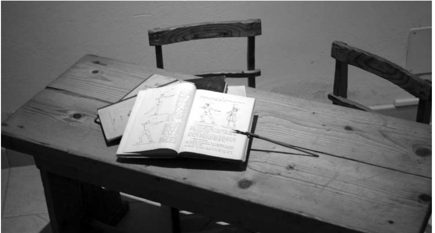
Banco di scuola

tunno del 1883 [...] si ebbe una netta separazione in due parti, cioè i sostenitori della scuola tedesca (i tedeschi) e i loro avversari (italiani). La lotta tra queste parti veniva spesso e volentieri condotta in modo assai astioso, sfociando non di rado in avversità personali che minavano gravemente la pace dell'isolato comune di montagna, sicché gli animi agitati fino ad oggi non hanno trovato pace».